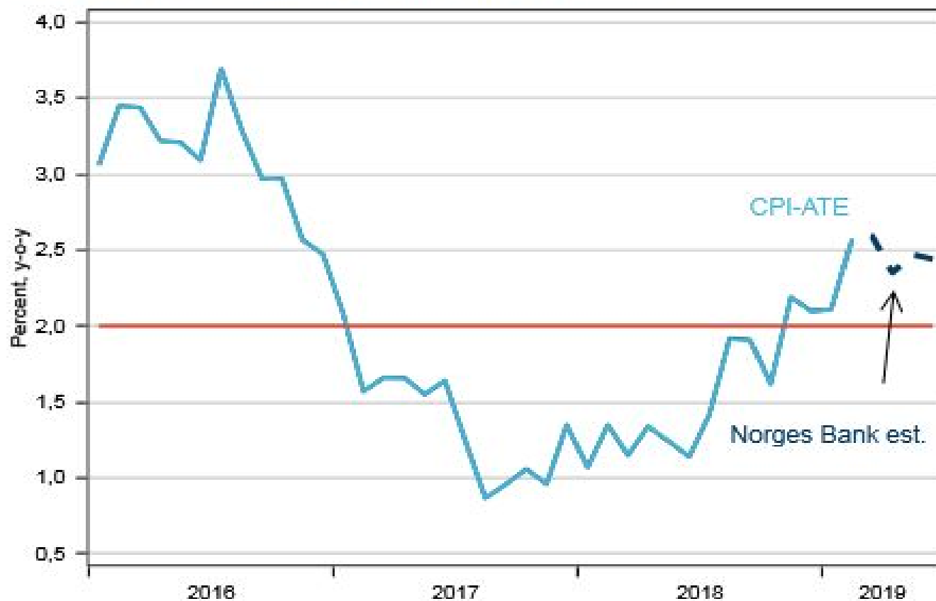
Core inflation (CPI-ATE), actual and expected