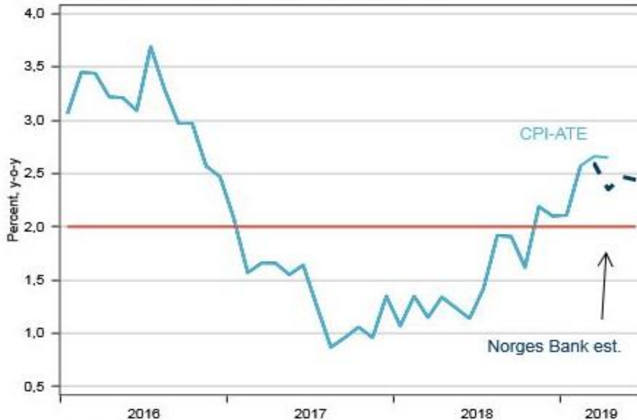
Core inflation (CPI-ATE), actual and expected