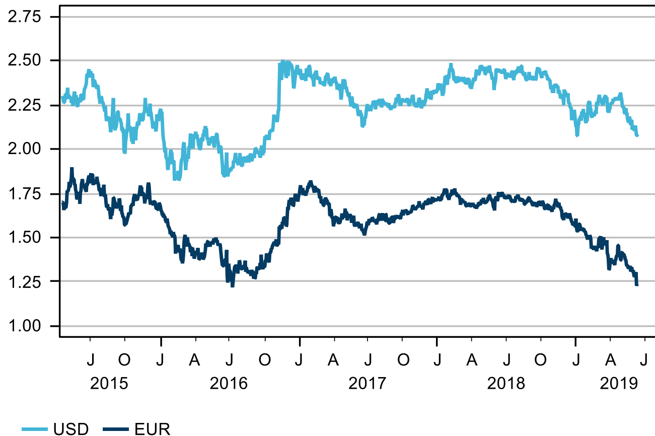
Breakeven inflation 5 year in 5 years