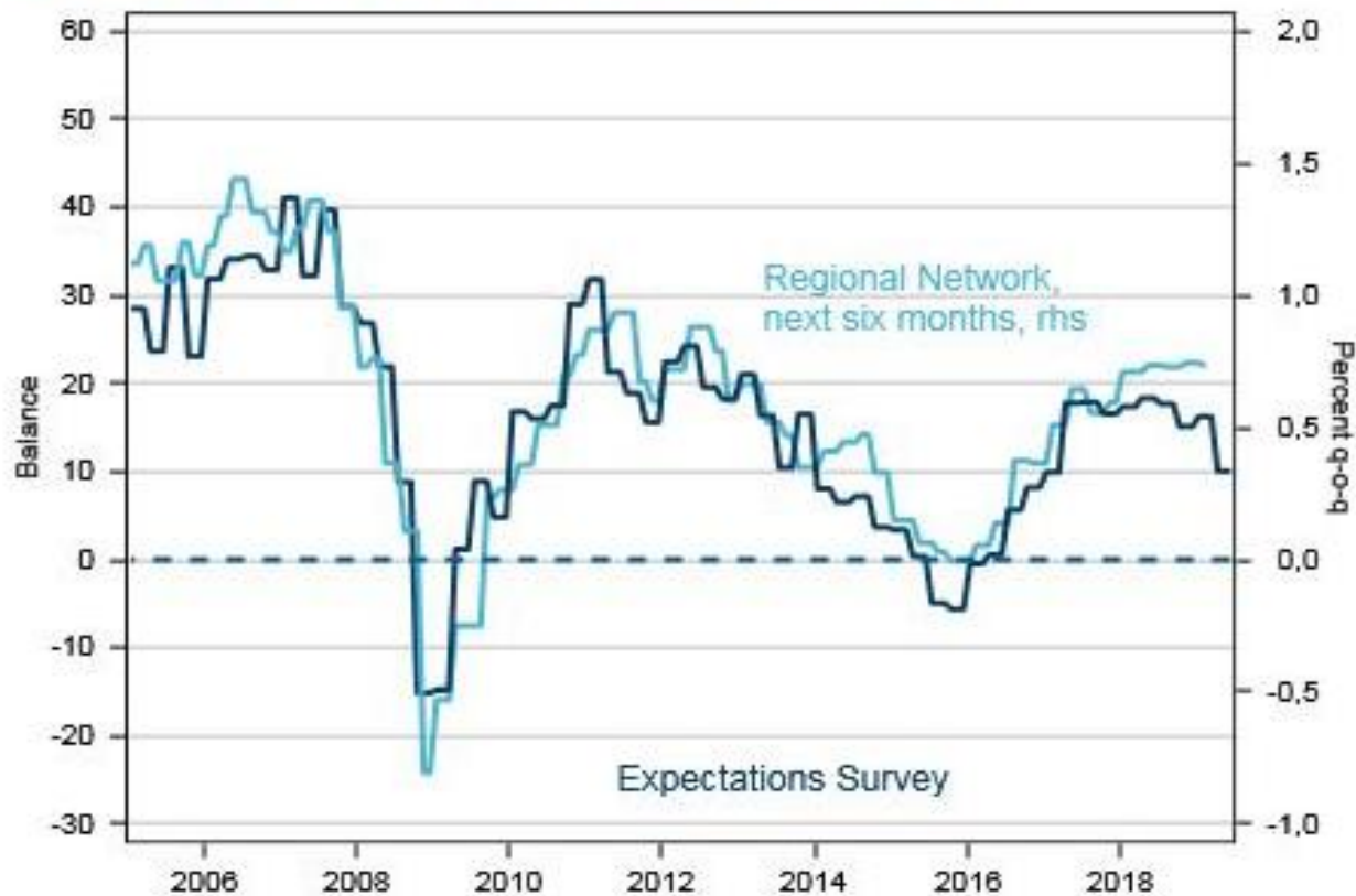
Regional Network and NBs Expectations Survey